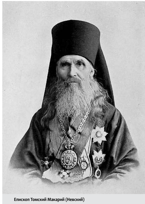
Епископ Томский Макарий (Невский)

О том, как совершались ежегодные поездки миссионеров для проповеди Евангелия некрещеным инородцам Алтая в период управления миссией епископом Макарием (Невским), свидетельствуют ежегодные отчеты о деятельности Алтайской и Киргизской миссий и записки миссионеров, которые печатались, как правило, в неофициальном отделе Томских епархиальных ведомостей. «Для миссионерской проповеди некрещеным инородцам, – читаем в отчете миссии за 1884 г., – совершаемы были, как и прежде, поездки в места их жительств каждым миссионером в пределах своего отделения, Начальником миссий по всем отделениям Бийского округа и некоторым улусам