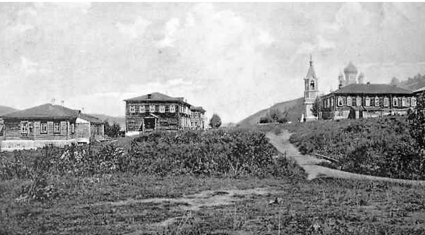
Улаинский миссионерский монастырь. Фото 1910-х годов

Однако благодаря своей непроходимости и труднодоступности Чулышманское отделение имело некоторое преимущество – в частности, власть зайсанов и димичей