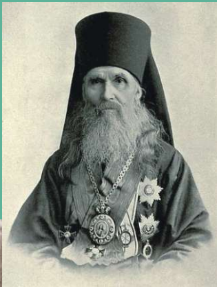
Святитель Макарий (Невский)

Хорошо служить страждущим, ...но нужно и о душе своей заботиться так же, как и о страждущих телесно. Пути спасения многообразны, не место спасает, а произволение. Везде можно спастись, но везде можно и погибнуть. Адам и Ева согрешили и погибли в раю, а разбойник спасся на кресте. Марию Египетскую погубили своеволие и большой город, но спасла пустыня.